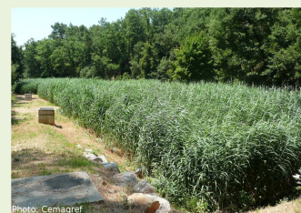
Filtres Plantés de Roseaux

SATESE, Services de Police de l'Eau, centre de recherche Irstea, Agences de l'Eau, ministères en charge de de l'environnement et de la santé, Onema, Oleau